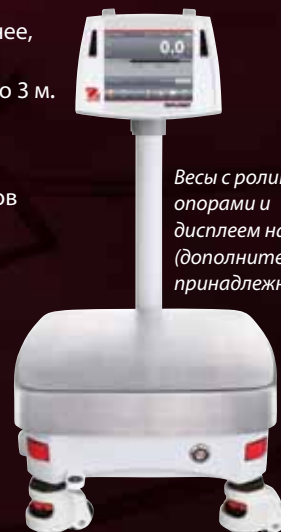
Весы с роликовыми опорами и дисплеем на стойке (дополнительные принадлежности)